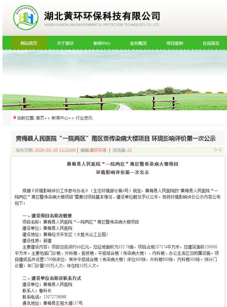
图 2-1 项目第一次公示截图