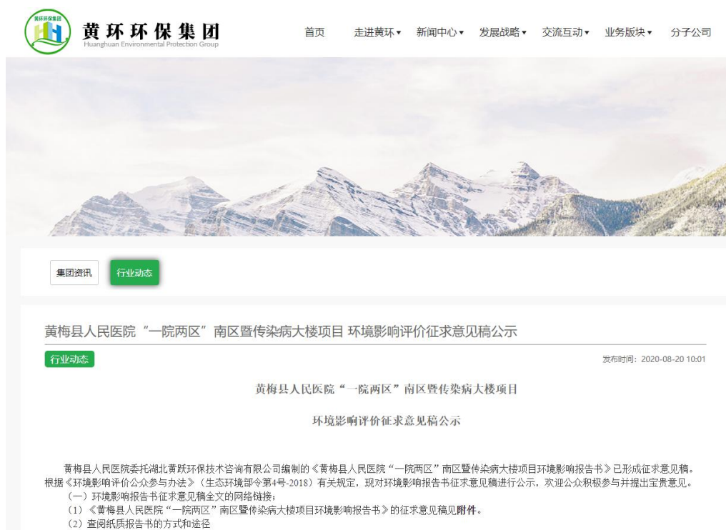
图 3-1 项目征求意见稿公示信息网上公示截图

( http://hhhb2019.35xg.com/index.php/index/ashow_65.html ) 上将征求意见稿公开信息进行了公示,符合《环境影响评价公众参与办法》在项目所在地相关网站公示的规定,公示截图见图 3-1。